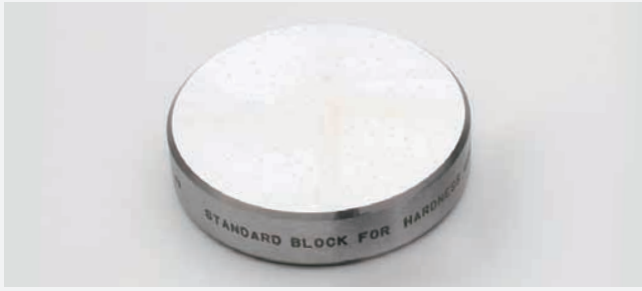
硬さ標準片 Hardness standard block

Hardness standard block(standard or optinal accessories)