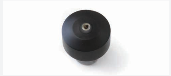
ダイヤモンドスポット Diamond Anvil

Hardness standard block(standard or optinal accessories)